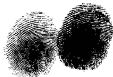
(Firmado con el pie)