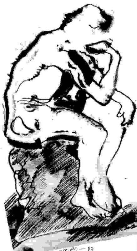
FRANCISCO HERRERO. - 83