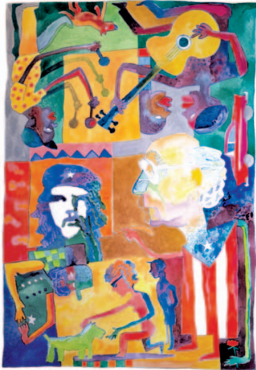
J.J. Lacalle "Laka": Saramago estuvo en Cuba. Acuarela sobre papel. 70 x 50 cm.