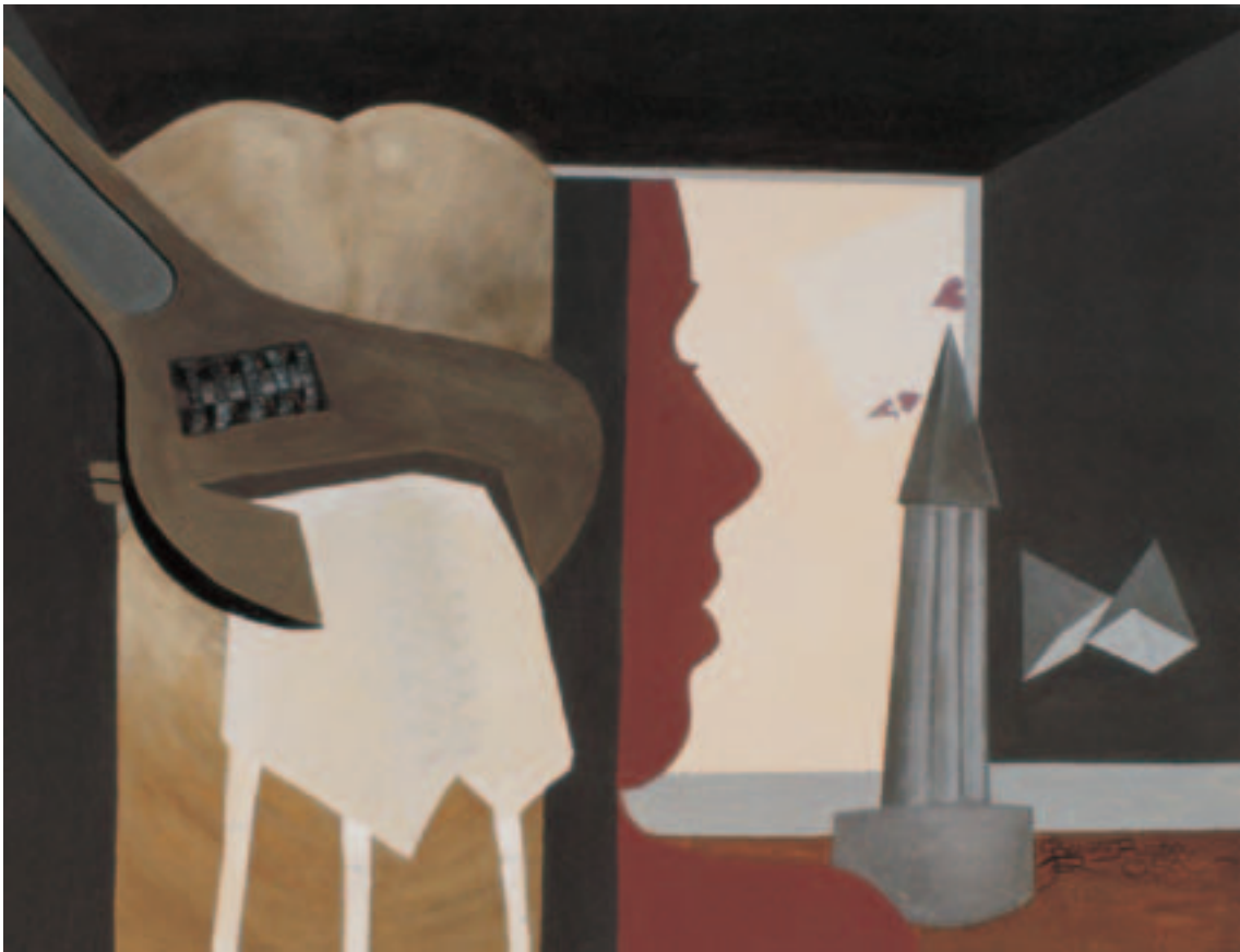
Gracieta Rosa Rosa: O corpo vai-se esquecendo de ter razão . Acrílico. 115 x 90 cm.