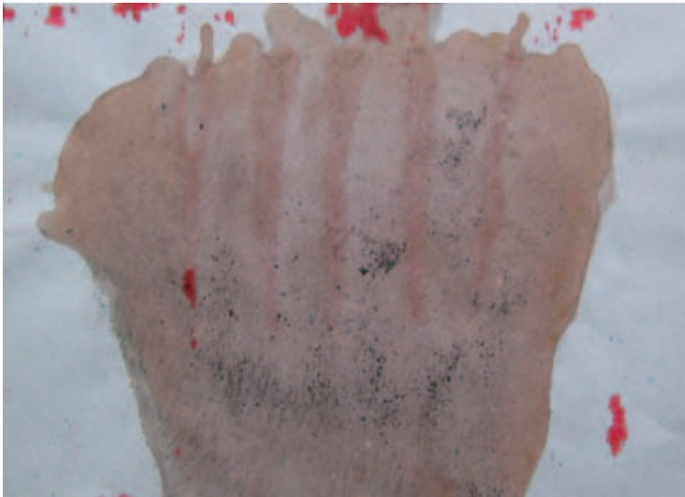
Begoña Usaola: Sin título . Técnica mixta sobre papel. 25 x 35 cm.