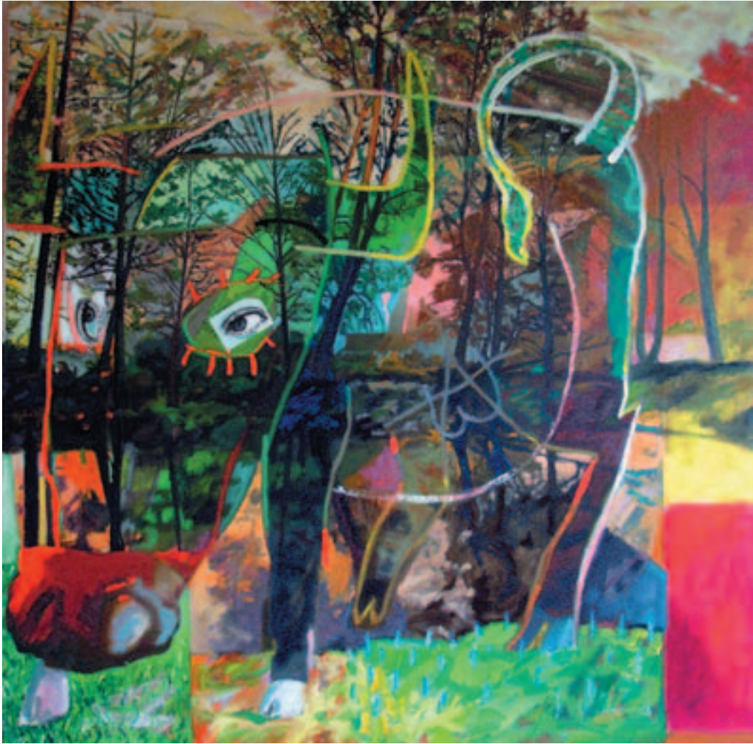
Fernando Eguidazu: Elogio de Islero . Óleo sobre lienzo. 126 x 126 cm.