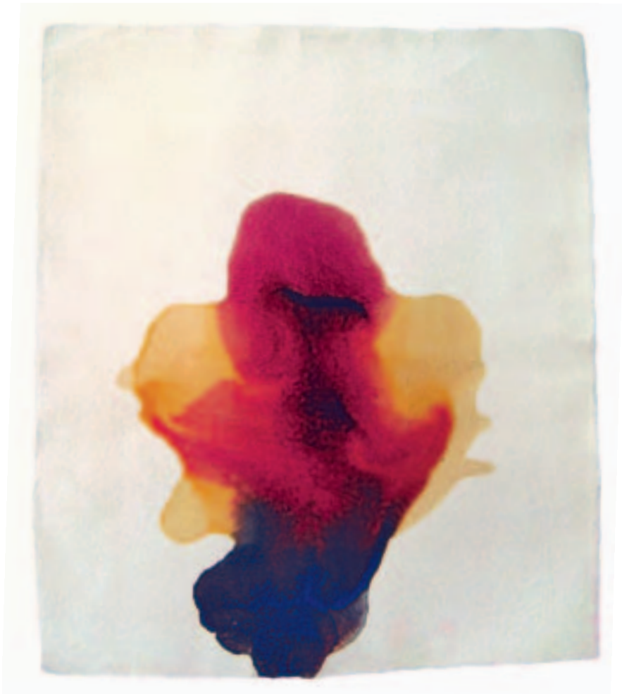
Begoña Usaola: Barniz y pigmento sobre papel. 50 x 40 cm.