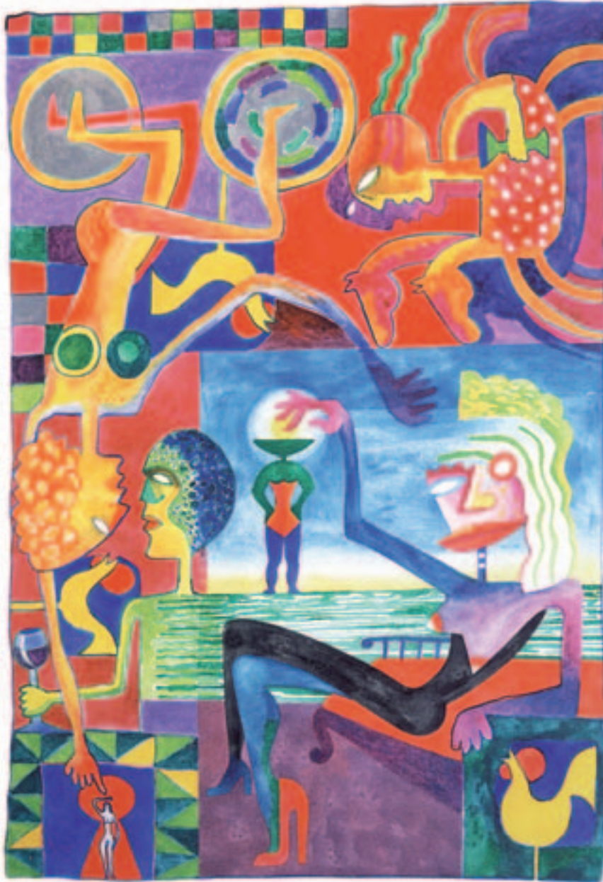
J.J. Lacalle "Laka": Señora de Estoril . Acuarela sobre papel. 70 x 50 cm.