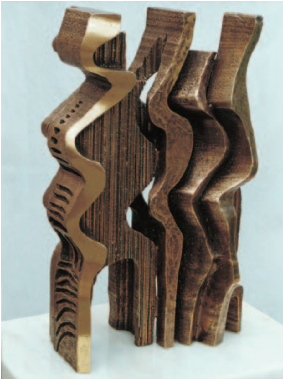
Alberto Gordillo. Escultura em bronze. 40 x 22 x 11