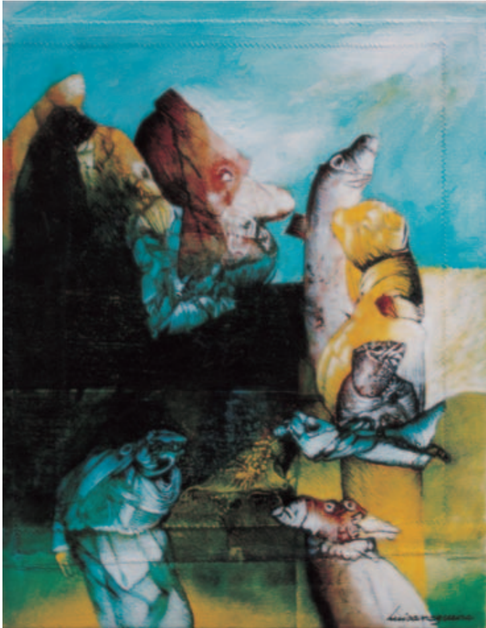
Luisa Nogueira: Óleo sobre lienzo.