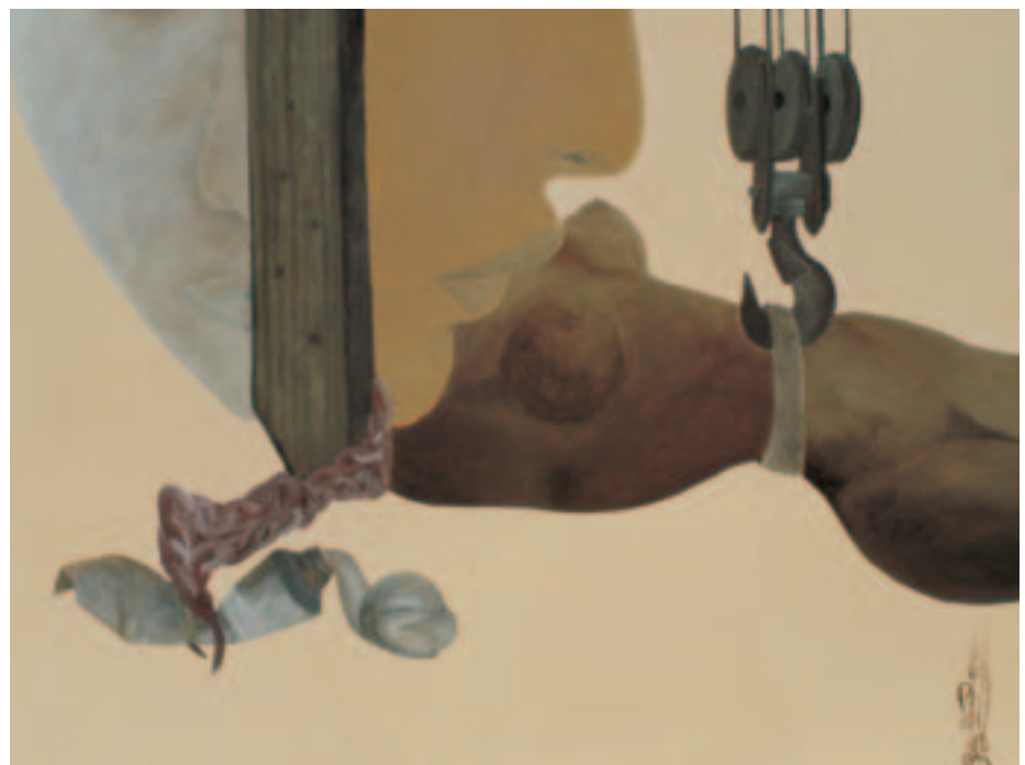
Graciete Rosa Rosa. (Acrílico sobre tela)